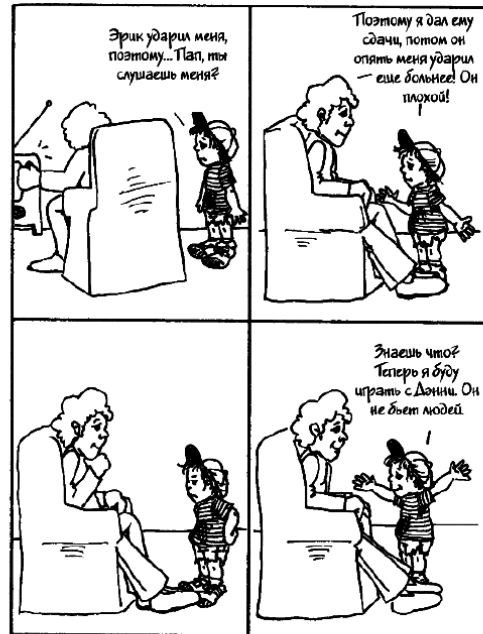
Гораздо легче рассказать отцу о своих неприятностях, если он действительно слушает. Ему даже необязательно что-то отвечать. Часто сочувственное молчание — это все, что нужно ребенку