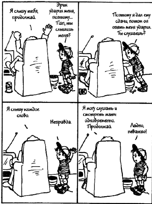
Попытки достучаться до кого-то, кто только говорит, что слушает, могут привести в уныние