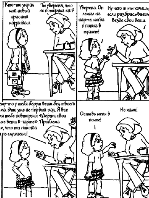
Ребенку сложно думать ясно или конструктивно, когда кто-то задает вопросы, обвиняет или советует ему