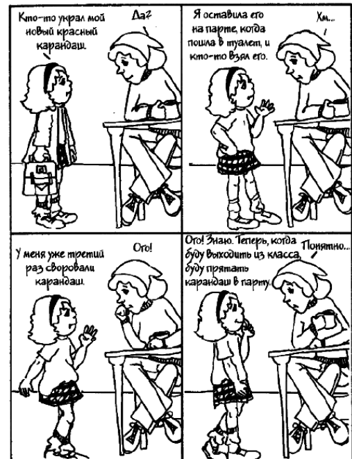
Простые слова «да...», «хм...» или «понятно» очень помогают. Подобные слова вкупе с внимательным отношением — это стимул для ребенка понять свои собственные мысли и чувства и, возможно, придумать свое решение проблемы