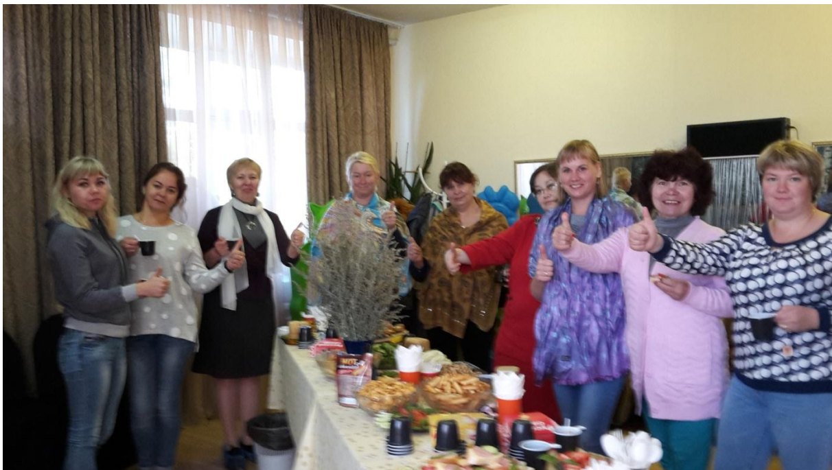
Первые слушатели курсов приехали.

специалистов, которым предстоит два месяца работать над планом профилактики деструктивных процессов среди воспитанников в конкретном учреждении. Планы будут разнообразными и очень креативными. Организаторы надеются, что энтузиазм и хорошее настроение будут с каждым слушателем курсов на протяжении всего периода учебы. Впереди их ждет вторая - октябрьская - сессия и защита итоговой работы в ноябре.