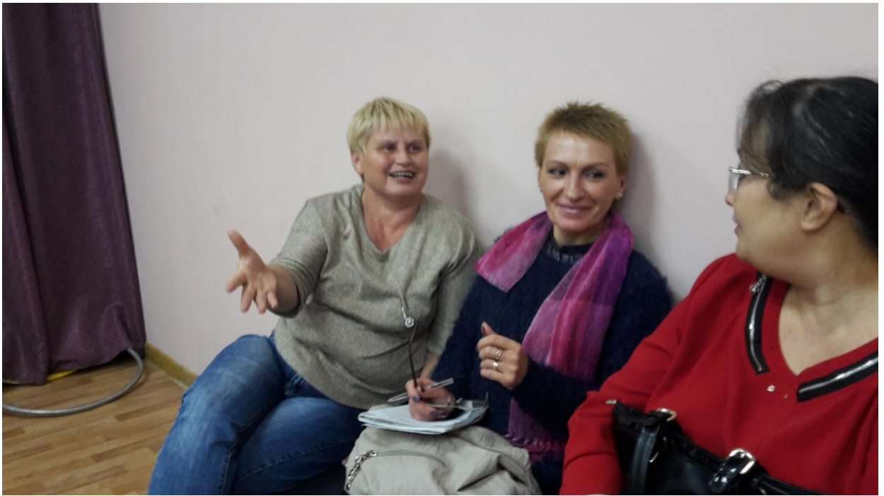
Реакция зрителей говорит сама за себя: эмоций много, мыслей – ещё больше. Дискуссия в зрительном зале.