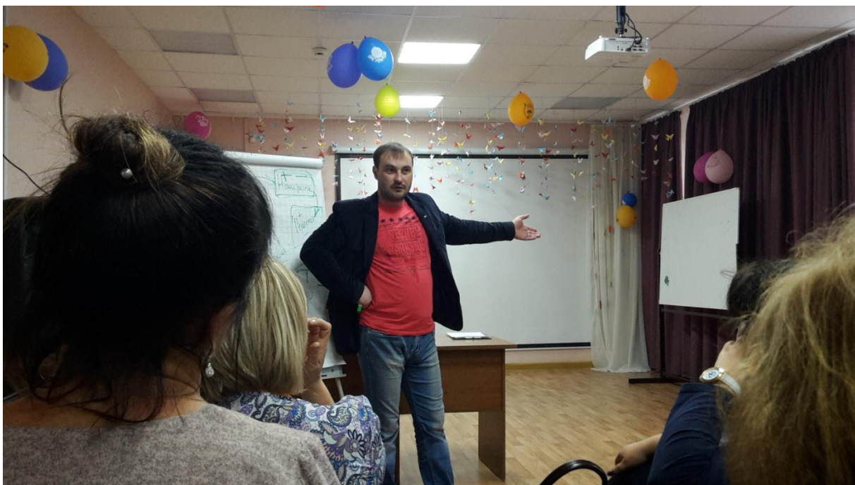
Ярко и эмоционально шли отдельные лекции